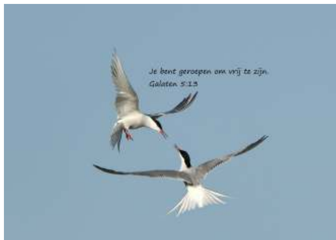
Twee pratende visdieven in de vrije lucht

We lezen dat de hedendaagse geloofsgemeenschappen te veel naar binnen zijn gekeerd en te veel gericht zijn op de zondagse eredienst. Het zal getuigen van vrijheid als de geloofsgemeenschap