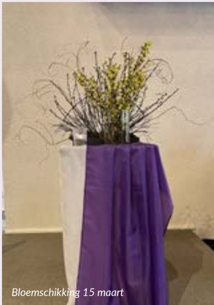
Bloemschikking 15 maart

Kernwoorden: Het is stil, in volle verwachting van beweging en een nieuw begin.