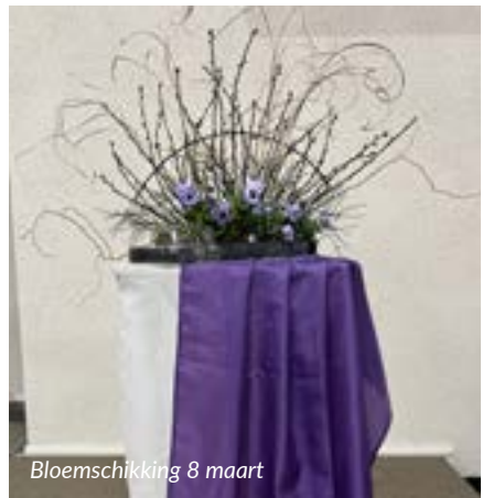
Bloemschikking 8 maart

Kernwoorden: Het is stil geworden, pijnlijke stekels en bloemen bloedrood bij het kruis